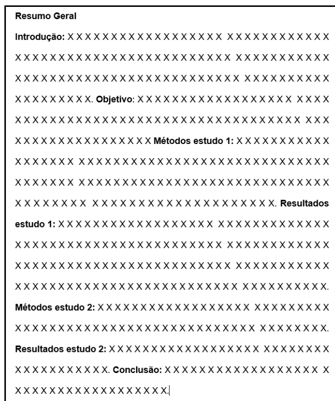
Figura 4 – Exemplo de estruturação do resumo.

Não há limite físico (número de caracteres ou páginas), mas recomenda-se limitar entre 1 e 2 páginas. O texto deve vir em bloco único (sem parágrafos ou recuos de 1ª linha). Preferencialmente, separados por tópicos, em negrito, como segue.